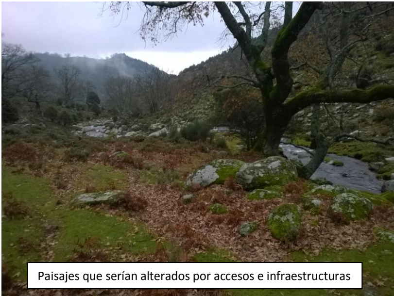
Paisajes que serían alterados por accesos e infraestructuras