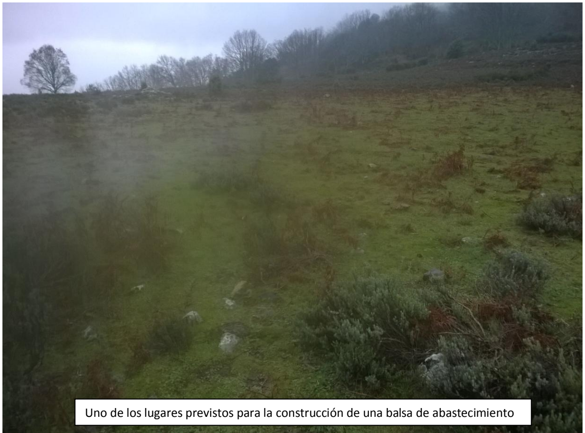
Uno de los lugares previstos para la construcción de una balsa de abastecimiento