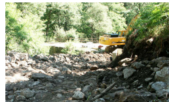
Obras de captación de aguas en el Arroyo de Castañarejo.