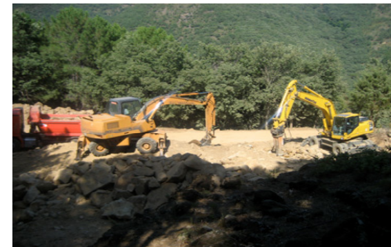
Máquinas trabajando en la zona donde se construirá el depósito de abastecimiento de agua para la urbanización.

Iban dirigidas al ayuntamiento, a Medio Ambiente, a Urbanismo, a la Confederación Hidrográfica del Tajo, al Juzgado de Arenas, al SEPRONA.