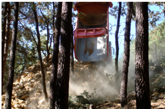
Camión arrojando escombros

Por tanto, la batalla no se ha acabado y hay que seguir afrontando gastos judiciales y administrativos. En estos momentos, tenemos que responder desde la vía jurídica a todos los recursos planteados por el promotor.