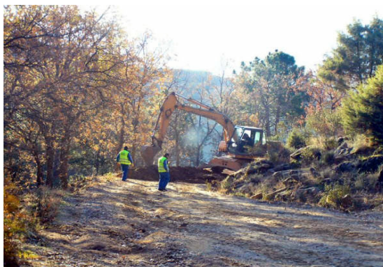
Reinicio de las obras

La Plataforma de Candeleda no dispone de medios económicos ni de subvenciones, sino que se sustenta con las aportaciones de sus integrantes y alguna pequeña venta realizada.